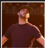
NO MERCY (CH)