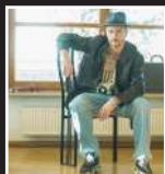
THE K (GER)