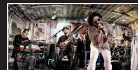
02. Juli 2022 JJ Hausband & Soul Train Party (CH)