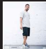
POE ONE (WW)