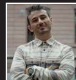
TUFF KID (CH)