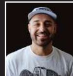
OB ONE (CH)