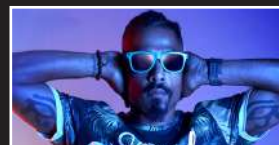
01. Juli 2022 Afu-Ra (USA)